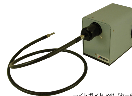
ライトガイドアダプター使用例